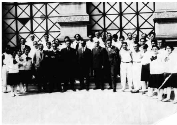
Foto 3. Alumnos y profesores del 6.º Curso para Maestros de Educación Física (1936)