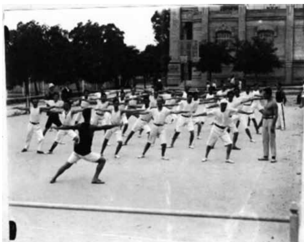
Foto 1. Clase de gimnasia en el 1.º Curso para Maestros de Plaza de Deportes (1920)

A continuación mostramos tres imágenes del 1.º, 3.º y 6.º cursos de maestros de educación física: