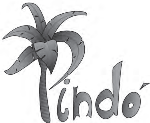
Figura 1. Logo Modelo Pindó