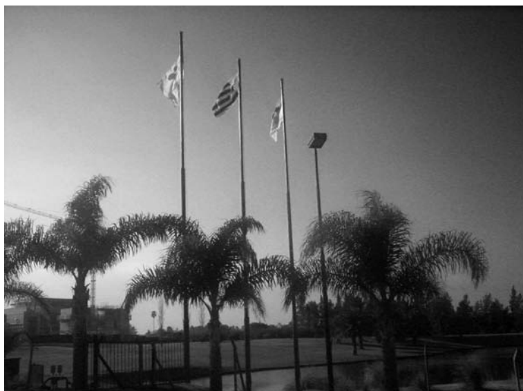
Imagen externa de Zonamérica donde aparece la bandera con el ícono de la empresa. Para otras imágenes véase la página web de la empresa: < www.zonamerica.com >