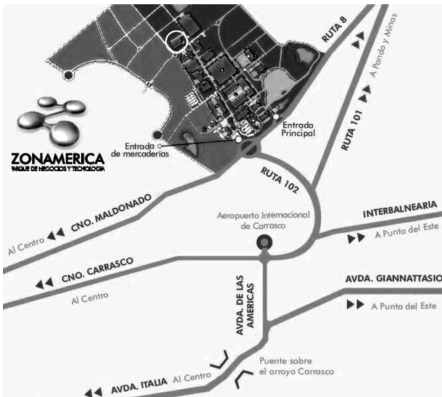
Mapa 1. Ubicación de Zonamérica.

En esta representación, aún no aparece el anillo perimetral que constituyó un elemento clave para la conexión de esta zona franca.