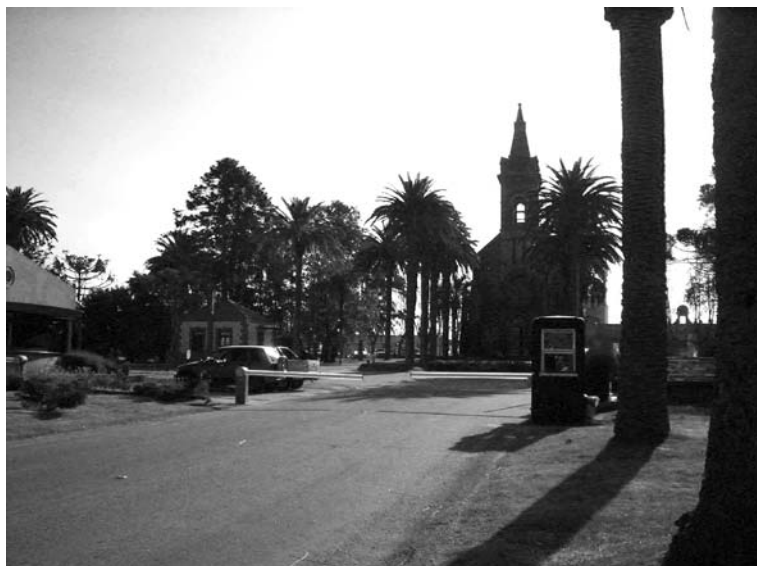
Imagen externa de Jacksonville (que no se autoidentifica como barrio privado) donde se observan las barreras desde su camino de acceso paralelo a un costado de Zonamérica.